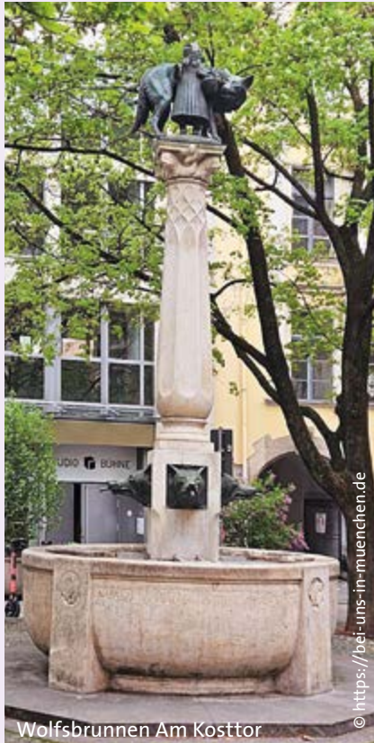
Wolfsbrunnen Am Kosttor

Am Donnerstag, 25. Juni , fahren wir nach München und lassen uns im Rahmen eines Stadtteilspaziergangs die geschichtsträchtige nördliche Altstadt (Kreuzviertel, Graggenauer Viertel) näherbringen: Stellen, an denen wir schon zig-mal vorbei-