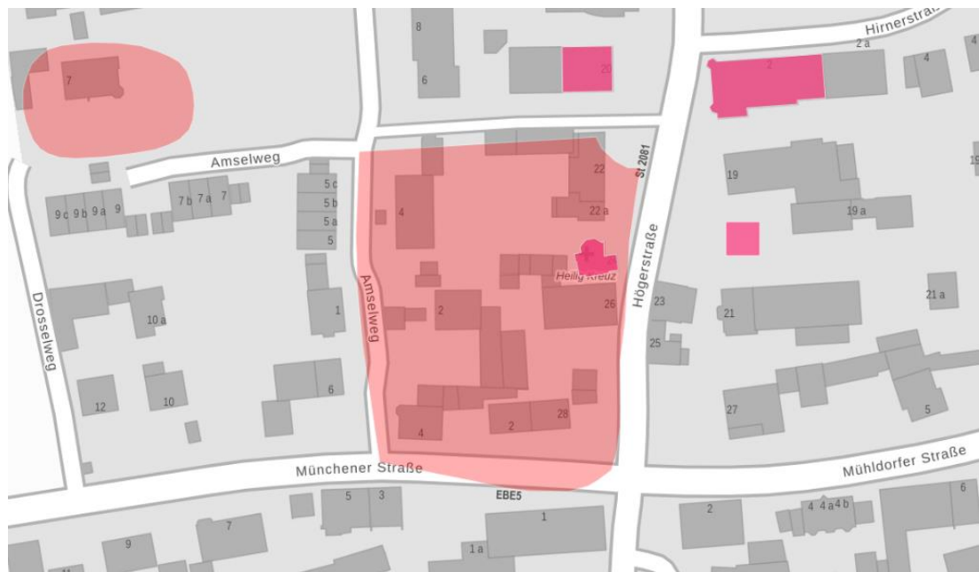
Abb. 1 Bau- und Bodendenkmäler im Bereich des Plangebiets, ohne Maßstab, Stand 23.03.2023

Bodendenkmäler: Der südliche und größte Teil des Plangebiets befindet sich auf der Fläche einer ehemaligen Schlossanlage, welche als Bodendenkmal Burgstall des späten Mittelalters und der frühen Neuzeit ("Schloss Anzing") (D-1-7837-0002) kartiert ist.