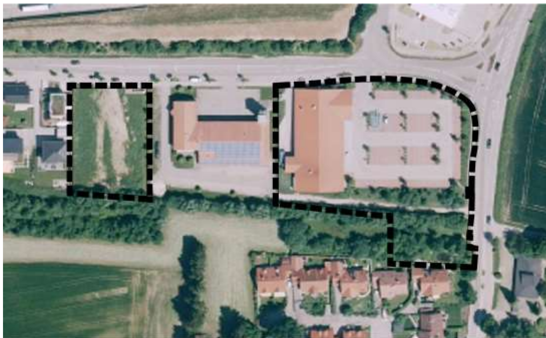
Abb. 3: Luftbild des Plangebiets mit Geltungsbereich (schwarze Umrandung), (Geobasisdaten © Bayerische Vermessungsverwaltung 2015)

Im Geltungsbereich des Bebauungsplans sind keine Schutzgebiete nach dem Bundesnaturschutzgesetz ausgewiesen.