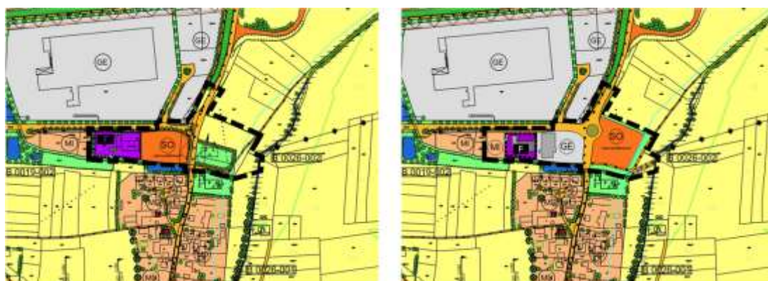
Abb. 1: Rechtswirksamer FNP der Gemeinde Anzing in der Fassung vom 05.06.2012 inklusive der 1. Änderung in der Fassung vom 01.04.2014 (links) und der zugehörigen 3. Änderung (rechts)

Zur Erschließung des neuen Sondergebiets plant die Gemeinde Anzing einen Kreisverkehr mit einem Durchmesser von 40 m im Kreuzungsbereich der Staatstraße mit der künftigen Kreisstraße EBE 1 („Gewerbepark“). Dieser Kreisverkehr wird neu als öffentliche Verkehrsfläche im Bereich der Erdinger Straße dargestellt und soll als Bestandteil der Staatstraße vom Straßenbauamt München gewidmet werden. Da in diesem Bereich des Kreisverkehrs künftig beidseitig eine Bebauung vorhanden sein wird, beabsichtigt die Gemeinde Anzing die neue OD-Grenze nach den Ortsdurchfahrtsrichtlinien nach Norden, nördlich des Kreisverkehrs, zu verlegen. Entsprechend diesem, mit dem Straßenbauamt abgestimmten Vorgehen, entfällt in der 3. Änderung des Flächennutzungsplanes die Darstellung der 20 m breiten Anbauverbotszone östlich und westlich der Staatsstraße St 2081 im Bereich der Grundstücke Fl. Nrn. 667 und 608.